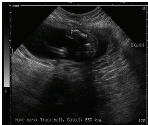
图1 成骨发育不良长骨短,成角弯曲